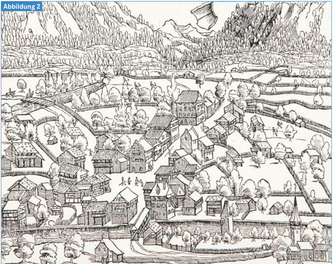
Ältestes Dorfbild von Sarnen: Holzschnitt in Johann Stumpfs Schweizerchronik von 1548.